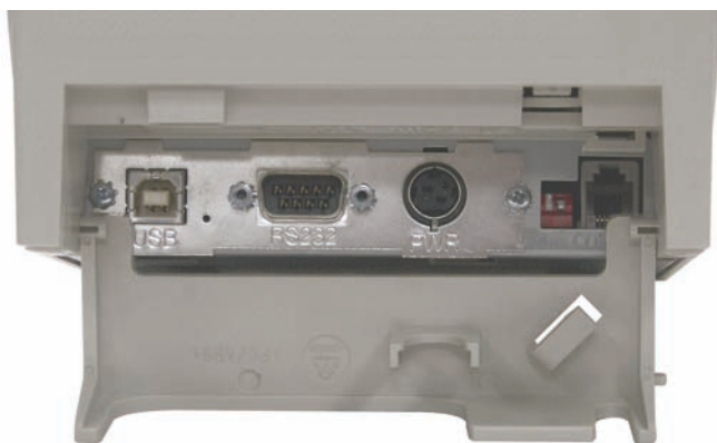
Versión con Interfase RS232 Serial y USB

La impresora A798 representa la siguiente generación de impresoras de recibos confiables, de alto desempeño y bajo precio. Construida bajo la reputación de CognitiveTPG de entregar impresoras durables, la A798 combina alta velocidad de impresión (150mm/s) con una huella pequeña, interfase dual estándar e impresión monocromática.